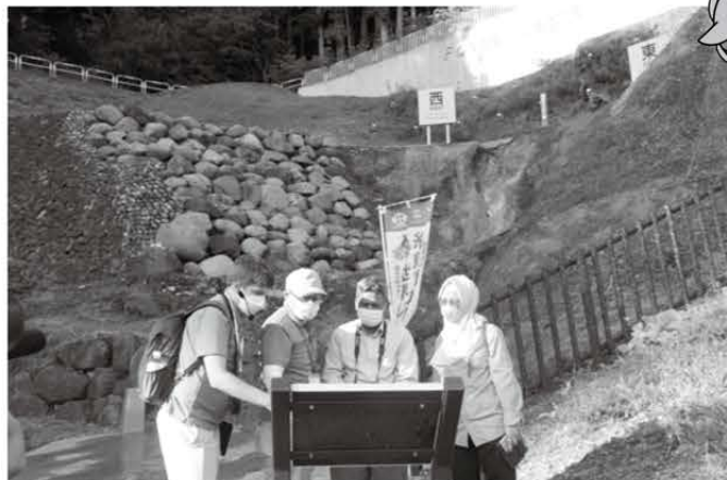
フォッサマグナパークでの現地調査

糸魚川ジオパークでは、感染状況を注視し対策を講じながら、ジオパーク学習や地域づくりなどの活動を展開しています。