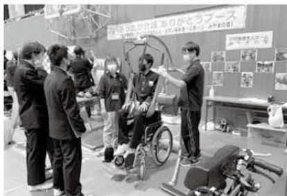
最新の福祉機器を体験