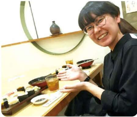
大阪での最後のランチ、寿司を堪能中