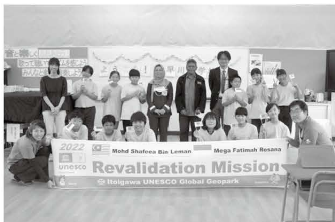
下早川小学校ではジオパーク学習発表が行われました