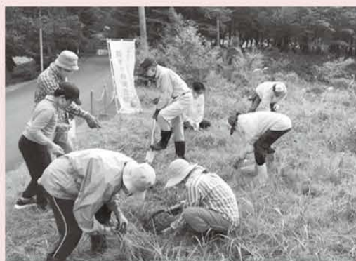
草刈り作業の後、球根を植栽しました

「ササユリ」の球根300球と宇宙に行った「宙ユリ」の球根170球を、参加者の手で丁寧に植えました。