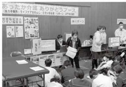
中学生に介護の仕事の魅力を発信