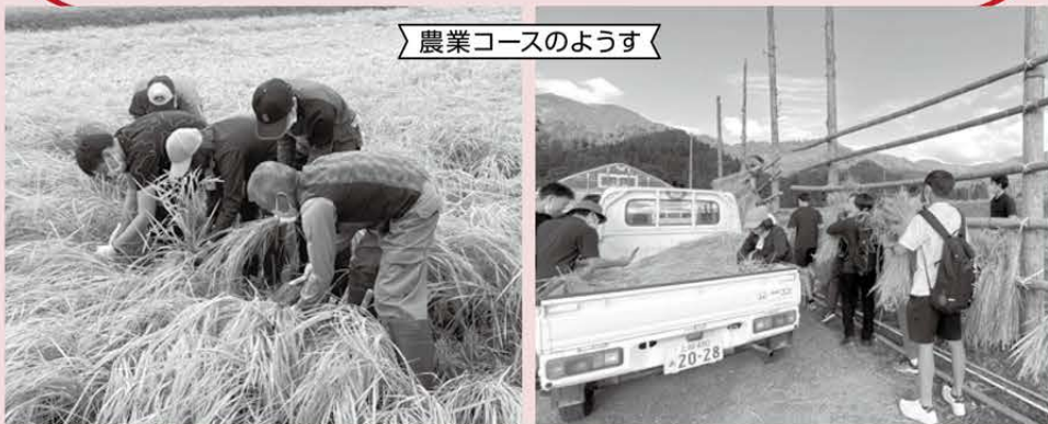
農業コースのようす

今年度は、農業・漁業・林業・観光業の4コースにわかれ、それぞれ体験学習を行いました。