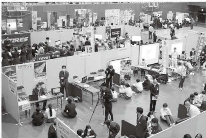
今年で3回目の開催!

市民総合体育館で、市内の全中学3年生306人を対象とし開催しました。市内外から57の企業・事業所が参加し、中学生に仕事のやりがいや誇り、地域に対する思いなどを伝えました。